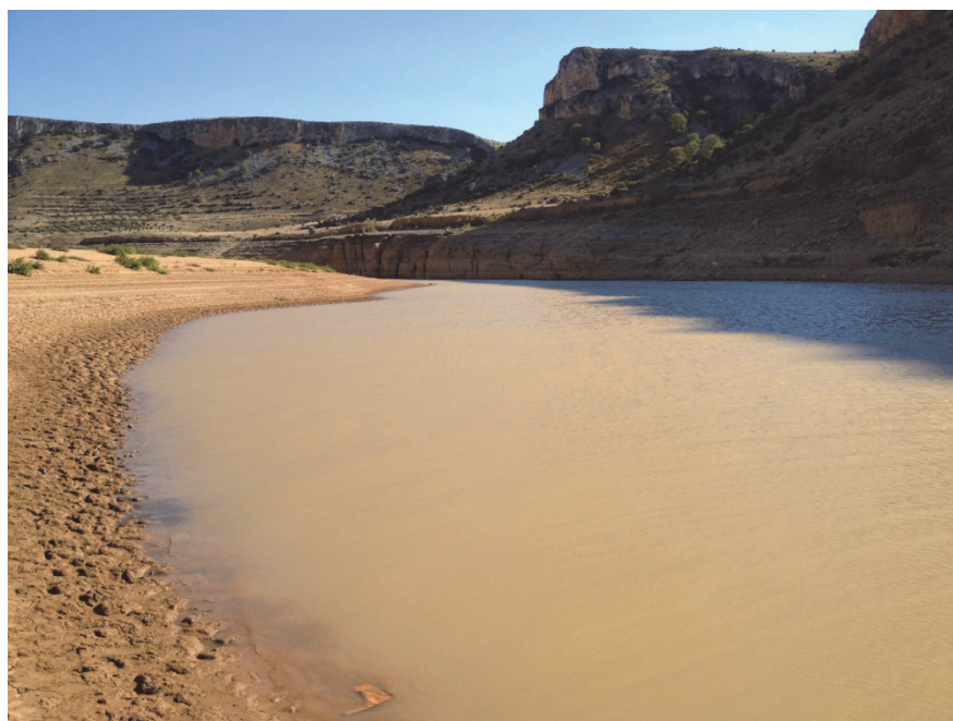
Figura 4: Vista general del embalse