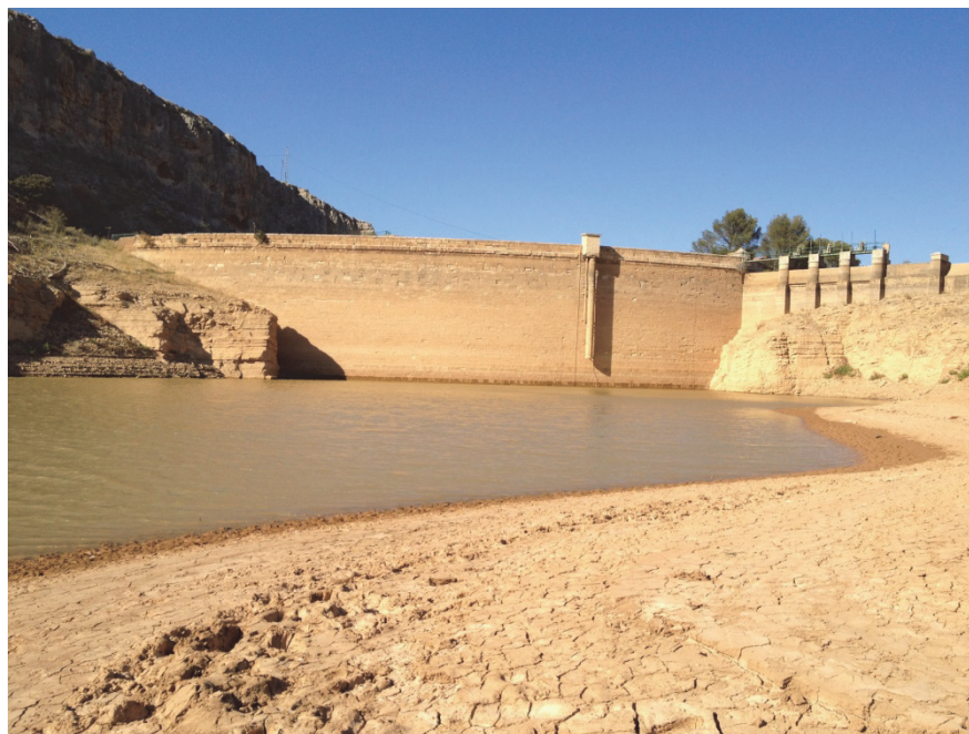
Figura 3: Vista de la presa del embalse