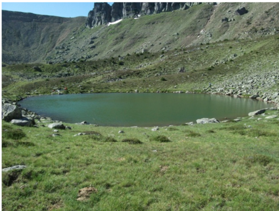
Vista de la laguna desde el litoral