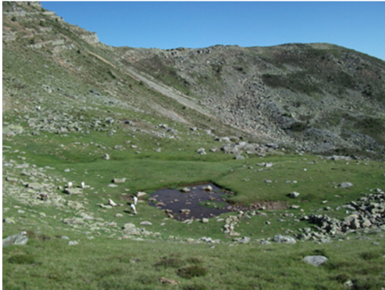
Laguna más pequeña del complejo lagunar. No muestreada