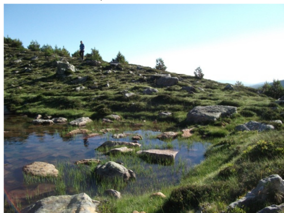
Litoral de la laguna muestreada.