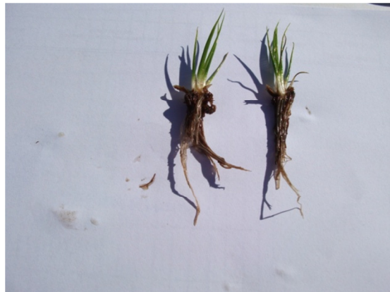
Hidrófitos: Isoetes sp