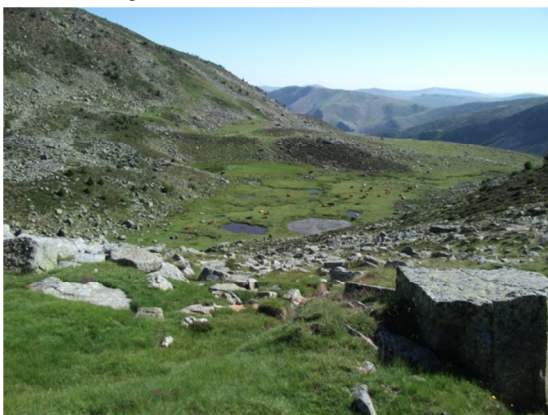
Otras lagunas del complejo con el ganado bovino alrededor.