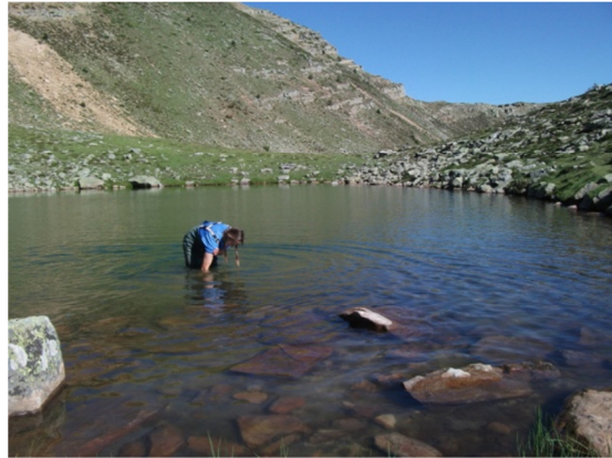
Muestreo de invertebrados bentónicos