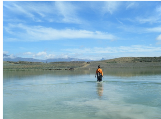
Muestreo invertebrados bentónicos 06/03/2013