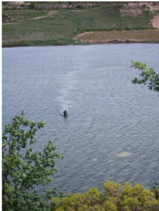
Imagen de la laguna con el técnico de campo realizando la toma de datos de macrófitos.