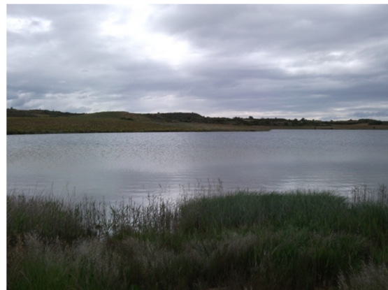
Vista de la laguna 06/03/2013