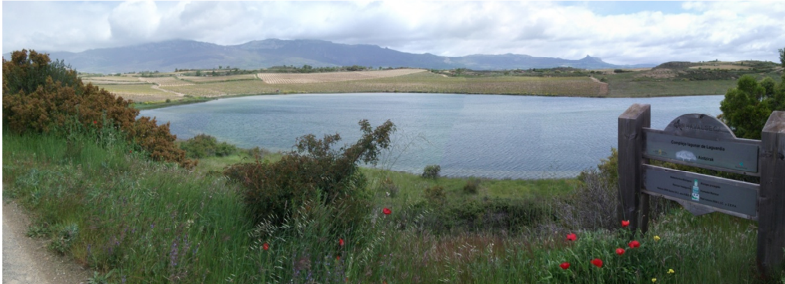
Vista panorámica de la laguna