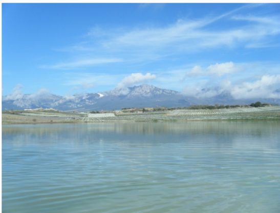
Vista de la laguna 06/03/2013