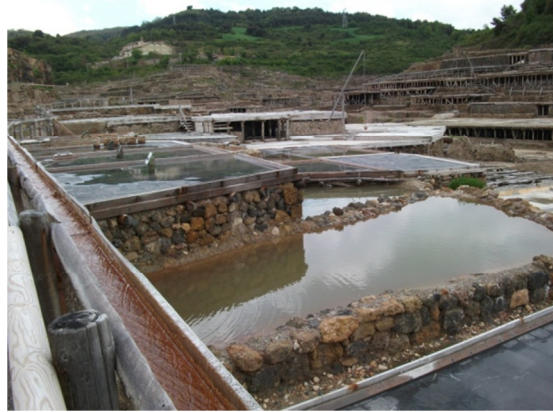
Balsas para la extracción se sal.