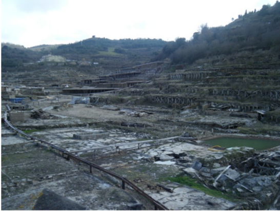
Vista general del Valle Salado de Añana.