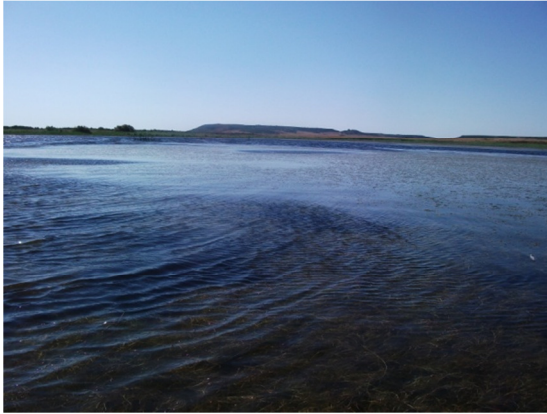
Vista de la laguna desde la orilla. Hidrófitos