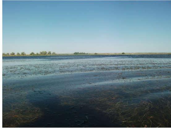
Vista de la laguna desde la orilla. Hidrófitos